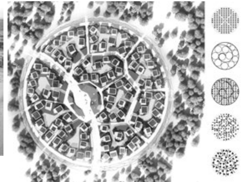
Conception du plan de masse (à gauche) et photo du District 11, centre d'innovation de Skolkovo en Russie. Source : agence Anthony Bechu & Associés.