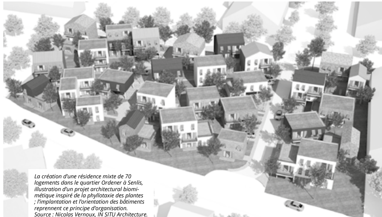
La création d'une résidence mixte de 70 logements dans le quartier Ordener à Senlis, illustration d'un projet architectural biomimétique inspiré de la phyllotaxie des plantes ; l'implantation et l'orientation des bâtiments reprennent ce principe d'organisation.

Le réchauffement de notre planète et l'augmentation des polluants nous obligent à revoir radicalement notre relation avec la nature si nous ne voulons pas détruire les fondements de la vie sur Terre et compromettre le bien-être des générations futures. Dans ce contexte, la construction et le logement revêtent une importance capitale,